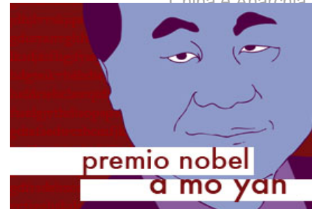
Nobel a Mo Yan