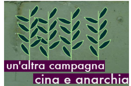
China e Anarchia