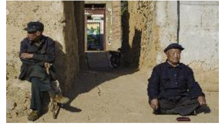
Immagini dalla Cina