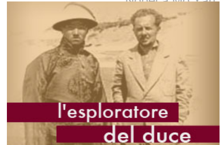
L'esploratore del Duce